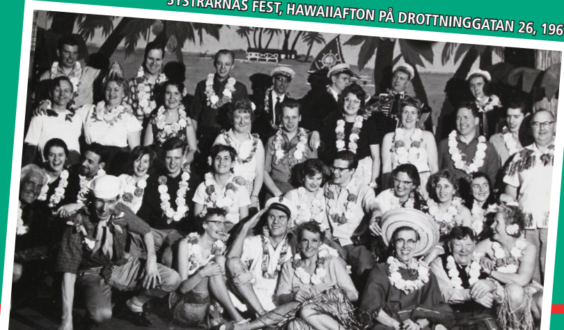
SYSTRARNAS FEST, HAWAIIAFTON PÅ DROTTNINGGATAN 26, 1961