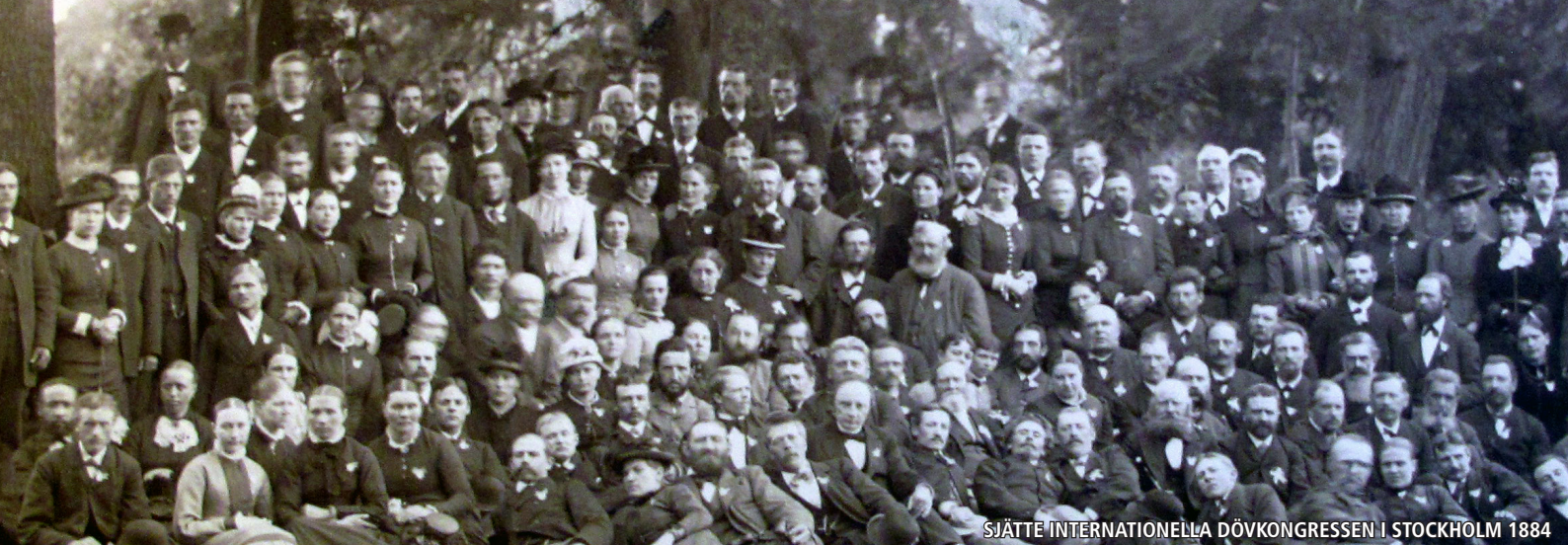
SJÄTTE INTERNATIONELLA DÖVKONGRESSEN I STOCKHOLM 1884